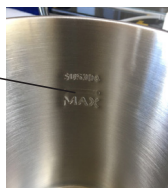
2 сур. Шәйнектің ішкі қабырғасы

Электр құралының элементтері (1,2 және 3 сур.):