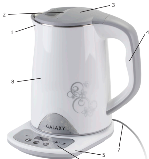
Рис. 1 Общий вид