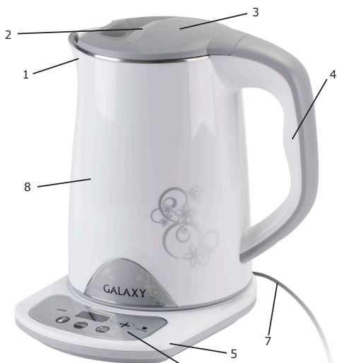
1 сур. Жалпы түрі