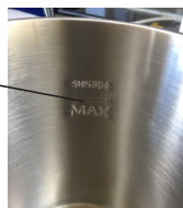
Рис. 2 Внутренняя стенка чайника

Элементы электроприбора (рис. 1, 2 и 3):